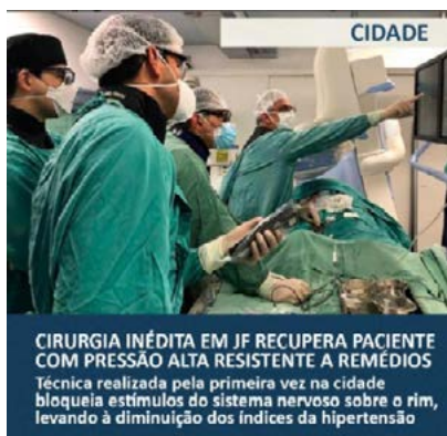
CIRURGIA INÉDITA EM JF RECUPERA PACIENTE COM PRESSÃO ALTA RESISTENTE A REMÉDIOS Técnica realizada pela primeira vez na cidade bloqueia estímulos do sistema nervoso sobre o rim, levando à diminuição dos índices da hipertensão

E m dezembro, dois novos casos de denervação renal foram realizados por equipe de cardiologistas intervencionistas da Hemodinâmica destacando o HMTJ no jornal Tribuna de Minas. O primeiro caso de Minas aconteceu em setembro,